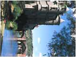
Vue traditionnelle Espalion - 01